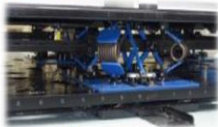
上下方向免震装置